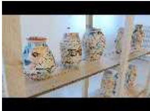
Airs de Paris, 2015. Installation. Céramiques, cartons, photos

http://alicebxl.com/en/artists/artist/colonel-and-spit