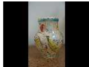
Mon Colonel & Spit - Airs de Paris