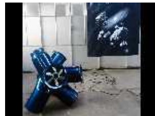
Jonas Locht - Smog machine