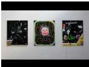
Laurent Impeduglia - Blackboard