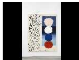
Atelier Pica Pica - sans titre