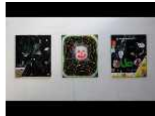
Impeduglia tryptique ordre accrochageLIGHT2